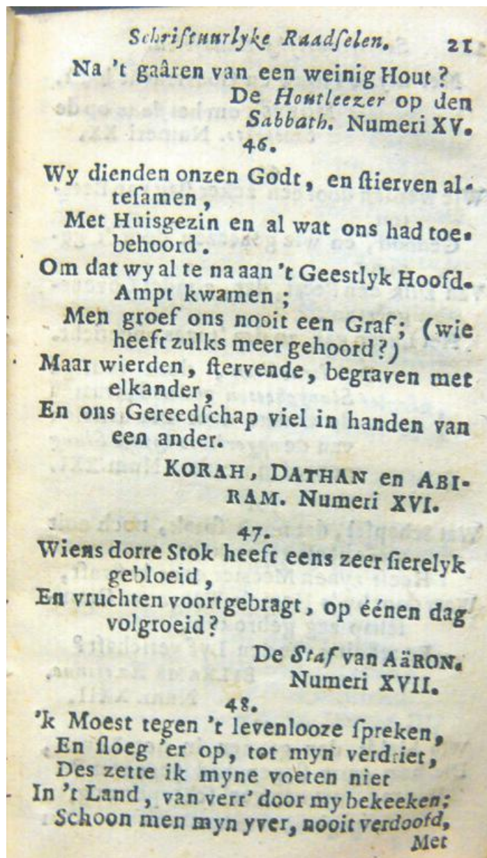
▲ Pagina uit Leidsman ter Bybelkennisse